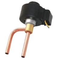
Электронный расширительный вентиль (ЭРВ)

В качестве дросселирующего устройства в модульных чиллерах LESSAR используется наиболее совершенный тип — электронный расширительный вентиль (ЭРВ). Электронные расширительные вентили выполняют те же функции, что и механические — понижение давления хладагента внутри контура, правильное заполнение испарителя жидким хладагентом и поддержание перегрева хладагента. Однако электронный расширительный вентиль быстрее реагирует на изменение тепловой нагрузки, что обеспечивает более точное поддержание температуры хладагента. Применение электронного расширительного вентиля позволяет экономить электроэнергию.