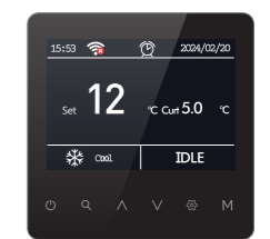
Пульт управления (в комплекте)

Модульные чиллеры оснащены электронными платами управления, которые могут объединяться в единую систему управления (до 16 модулей). Платы управления поддерживают совместимость с системами диспетчеризации по протоколу Modbus RS485 . Для управления чиллерами используется проводной пульт управления (входит в комплект поставки), с которого возможно осуществление выбора режима работы чиллера и изменение основных параметров работы. Доступно отображение аварийных кодов. С одного пульта управления доступно управление как отдельным чиллером, так и модульной системой до 16 чиллеров. Пульт управления имеет встроенный Wi-Fi-модуль , что предоставляет возможность удаленного мониторинга и управления со смартфона. Алгоритм управления предусматривает резервирование и ротацию как в рамках одного чиллера, так и в рамках модульной системы чиллеров.