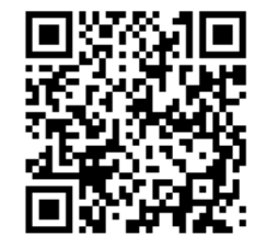
О принципе работы и преимуществах ЭРВ